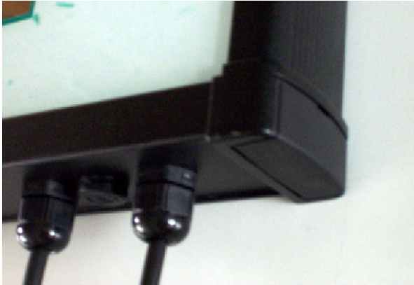
Eckstück des Rahmengerätes mit eingesetztem Abdeckwinkel

Eckstück mit eingesetzter Wandlasche zur einfachen Befestigung direkt an der Wand.